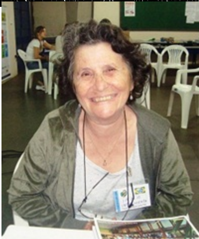
Laços de Amor