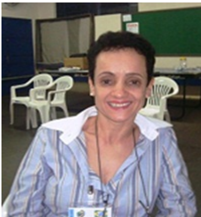
Casa de Custódia Berenice de Fátima M. Veiga

O curso “Aprender a Educar para a Paz” tem me proporcionado momentos de reflexão sobre a cultura da violência e a cultura da paz. É um espaço em que avaliamos as nossas ações e a nossa maneira de ver e agir no mundo. Acredito que o conteúdo discutido e refletido no grupo contribuirá muito na minha atuação profissional e também na convivência familiar e comunitária. Temos que pensar e acreditar em uma sociedade mais justa e pacífica, e cada cidadão pode ser um sujeito nesse processo.