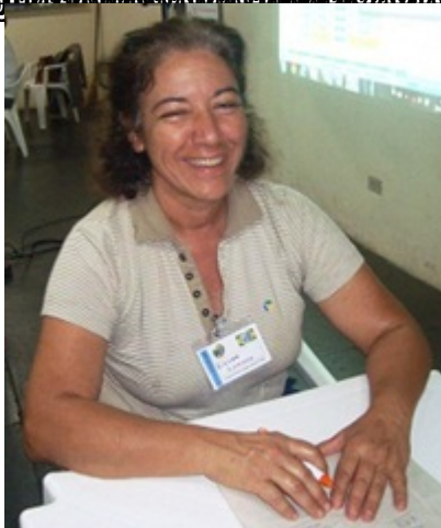
Sindicato Rural Patronal