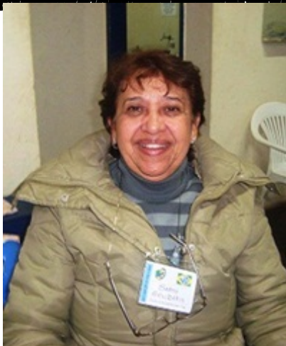
Escola Municipal Sarah Mafra