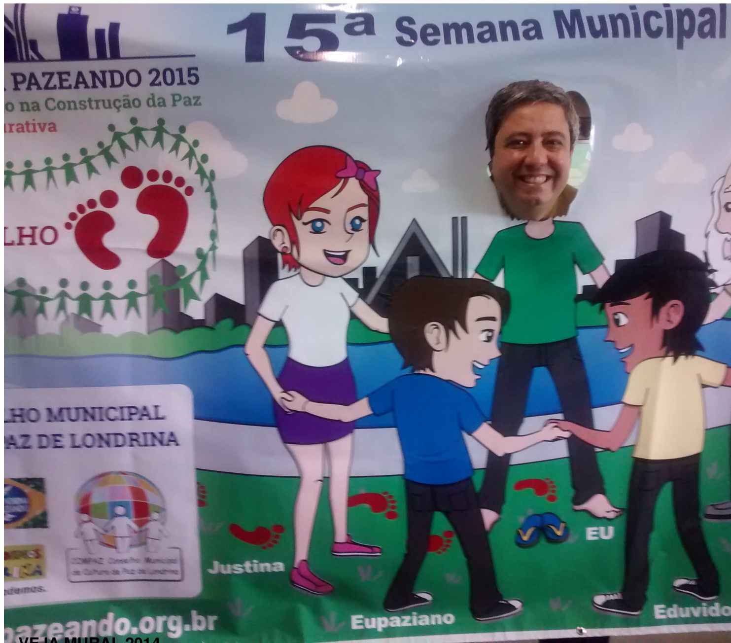
VEJA MURAL 2014