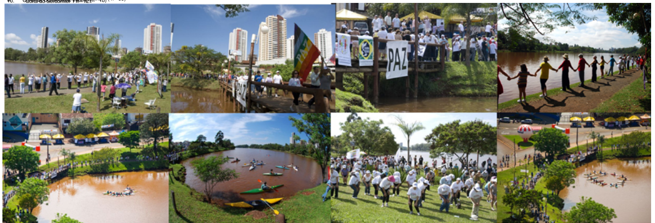
Foto Clube de Londrina: autores - Dirceu Vivan - Norman Neumaier - Mario Jorge Tavares - Rubens de Oliveira

Inscriva seu grupo, Luis L. Pozza, Vila Rica, fone: 3322-1788 / 8408-7463/ 9121-5502 ou Luis 9996-1283 Cidade de Londrina, Paraná, Brasil (R. 63)