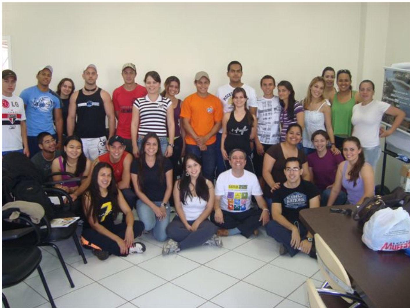
Foto na reunião de treinamento da equipe do SESI -lazer que ajudará no LEVANTE-SE! na sexta e no domingo